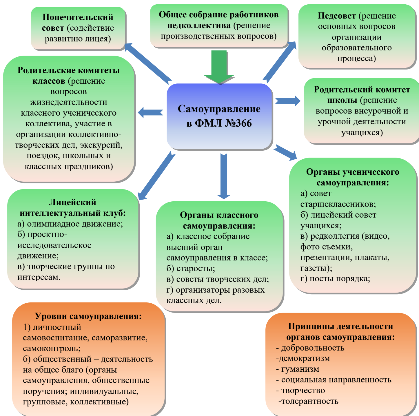
Рис. 1. Структура самоуправления ГБОУ ФМЛ № 366 Московского района Санкт-Петербурга