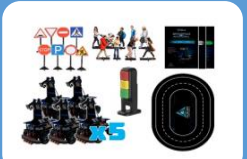
Образовательный комплекс для изучения основ компьютерного зрения