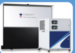
Мобильный интегрированный мультимедийный комплекс с 3D визуализацией