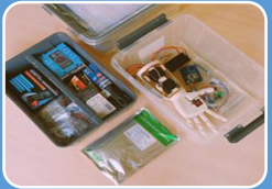
Лаборатория человеко-машинного взаимодействия