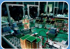
Интеллектуальные энергетические системы