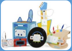
Лабораторный комплекс «Математика»