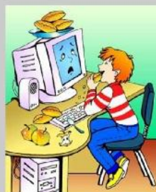
Не ешь за компьютером