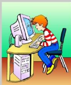
Не сиди близко к монитору

При работе за компьютером через каждый час необходимо делать перерыв 5 - 10 минут