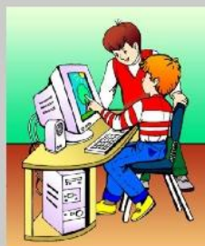
Не касайся монитора руками