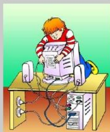
Не ремонтируй компьютер сам